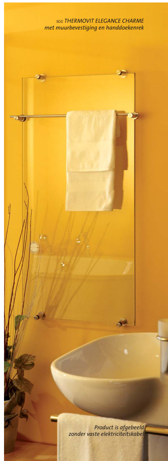
Product is afgebeeld zonder vaste elektriciteitskabel